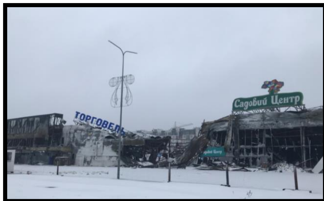
(※ウクライナ・破壊されたショッピングモール)