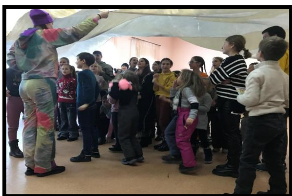
(※ウクライナ・孤児院にて)