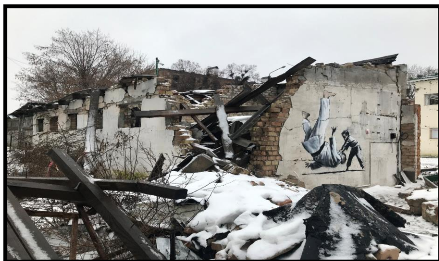
(※ウクライナ・破壊された街に描かれたバンクシーのメッセージ)