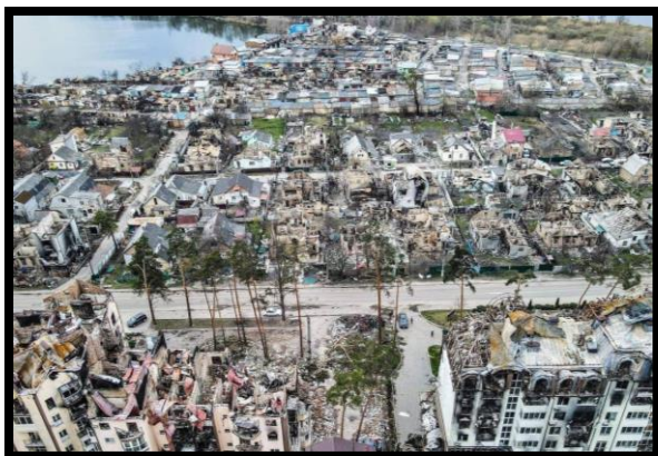
(※ウクライナ・破壊された街並み)

一方で、現在の戦争も描かなければと思い、2022年にはウクライナへ取材に行き、砲撃で破壊された町や戦争で親を亡くした子どもたちを映像に収めました。